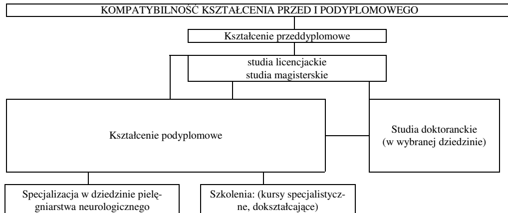
Ryc. 2. Kompatybilność kształcenia przed i podyplomowego